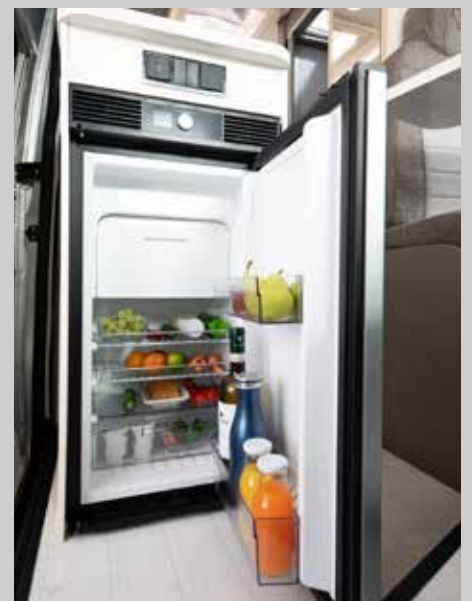
70 l Kompressorkühlschrank beidseitig aufklappbar von Dometic