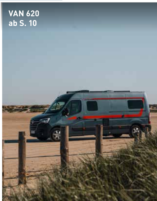
VAN 620 ab S. 10