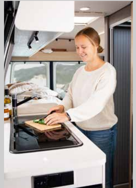
Modern designer Küchenblock