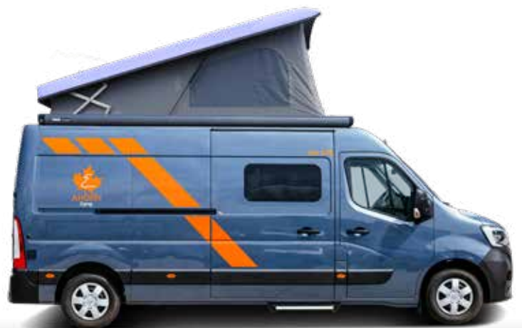
Familientauglichkeit dank 4 Schlafplätzen mit Aufstelldach ab S. 9