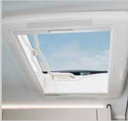
Neue große Dachluke im Frontbereich mit Verdunklungsrollo und Fliegengitter