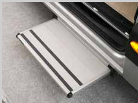
Komfortable, elektrische Trittstufe