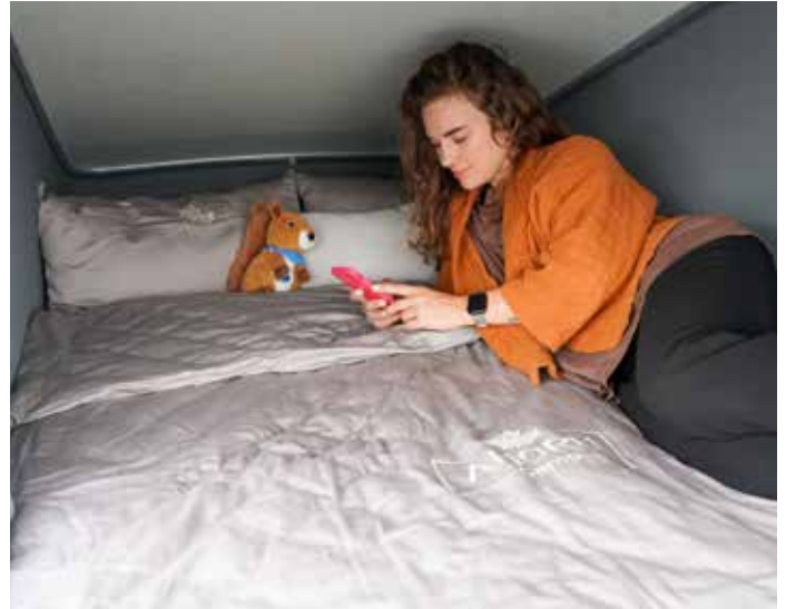
Zwei weitere vollwertige Schlafplätze im Aufstelldach

Die Vorteile des neuen Aufstelldachs gehen jedoch weit über den Schlafkomfort hinaus. Dank unkompliziertem Aufstellen des Daches innerhalb weniger Sekunden wird die Alltagstauglichkeit gewährleistet. Die hochwertigen Materialien der Dachoberschale gewährleisten zudem eine hohe Stabilität und eine optimale Isolierung aufgrund des 15 mm Isolationskerns. Scharniere und weitere Anbauteile aus Edelstahl bieten selbst in Salzwassernähe besten Korrosionsschutz. Ebenfalls ist für die Anbringung eines Dachgepäckträgers serienmäßig bereits eine Trägerschiene verbaut. Mit dem neuen Aufstelldach für die Van 620 Modelle erweitern wir die Möglichkeiten unserer Kunden, ihr Fahrzeug in ein komfortables Zuhause auf Rädern zu verwandeln und die Vans als vollwertige Familienfahrzeuge für bis zu vier Personen zu nutzen.