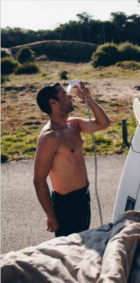
Praktische Außendusche im Heckbereich