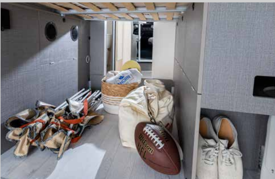
Neu organisierter Stauraum im Heck sorgt für optimale Raumnutzung